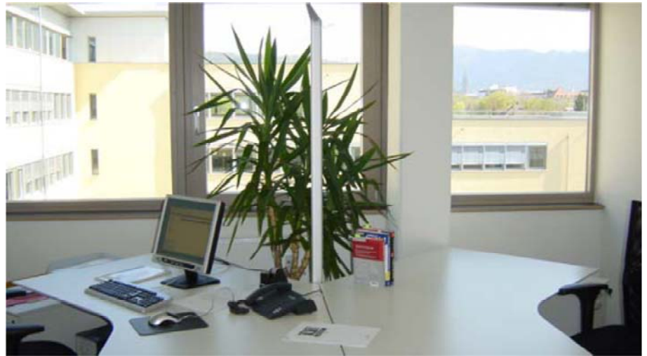
Ihr zukünftiger Arbeitsplatz